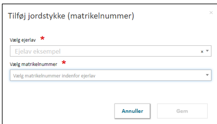
FIGUR 3, DIALOGBOKS FOR ANGIVELSE AF JORDSTYKKER.

Jordstykker angives ved at klikke på ”+Tilføj jordstykke (matrikelnummer)”, Figur 2, E , hvilket åbner dialogboksen for angivelse af jordstykker, Figur 3.