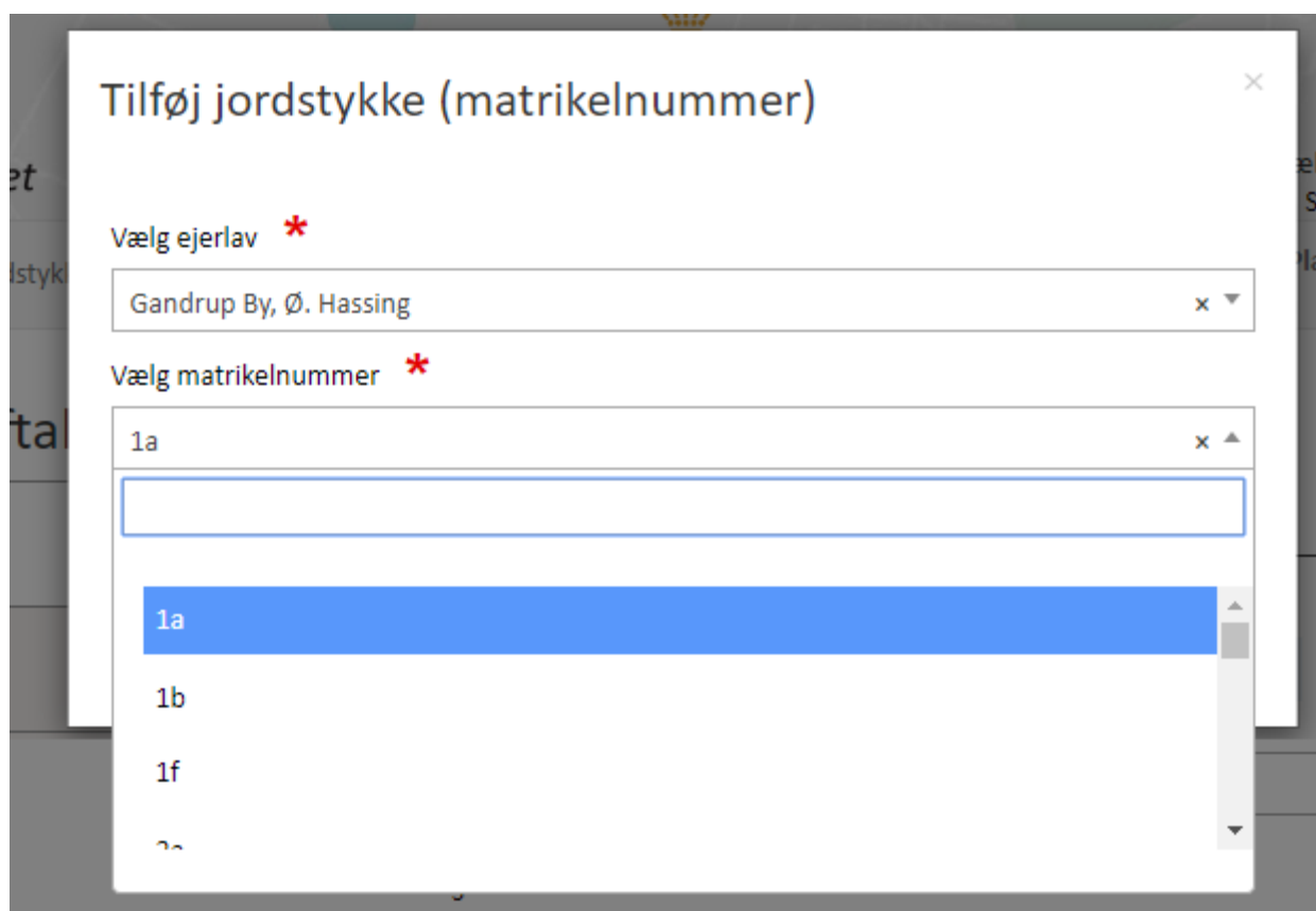
FIGUR 3. DET ER OBLIGATORISK AT ANGIVE, HVILKE JORDSTYKKER UDBYGNINGSAFTALEN GÆLDER FOR.

Det er obligatorisk at angive, hvilke jordstykker, udbygningsaftalen gælder for. Jordstykker registreres ved at klikke ”Tilføj jordstykke (matrikelnummer)”, Figur 2, E . Dette åbner for et nyt vindue, hvor det er muligt at vælge ejerlav samt matrikelnummer fra dropdown-menuen, Figur 3. Det er muligt at tilvælge flere jordstykker.